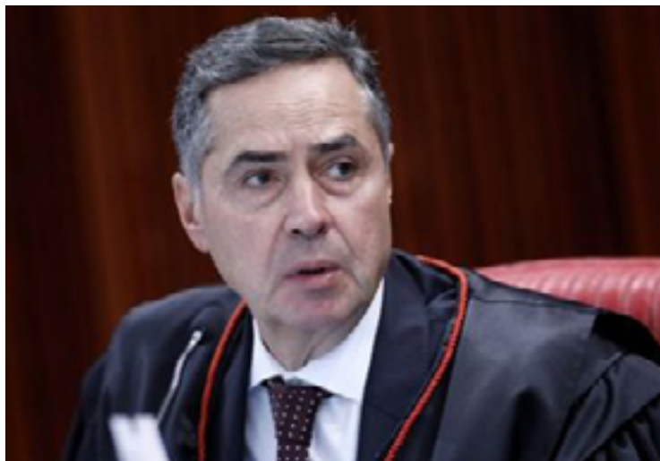
Luis Roberto Barroso: processos acumulados no STF sobre denúncias contra políticos

O STF possui atualmente 51 inquéritos sob sua alçada, dos quais 27 superam a marca de mil dias. Já o número total de ações penais na Corte é de 1.376. Dessa lista, 13 processos também superam a marca dos três anos de andamento. Os da-