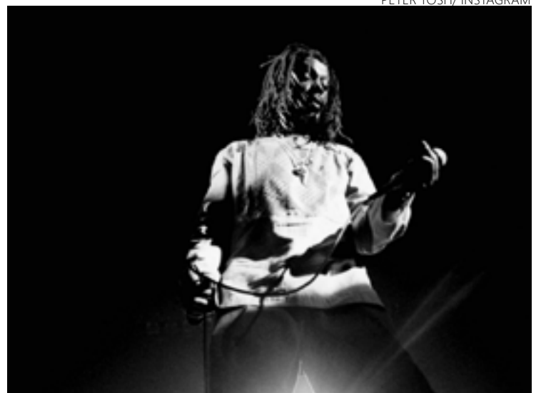
Peter Tosh, em retrato feito no ano de 1979: expoente de peso do reggae

qualquer streaming, de modo a entender melhor sobre o que falo. Mas, veja só, adianto: é boa música, do tipo que faz o sujeito se repetir na audição e, lá pelas tantas, se perceber apaixonado.