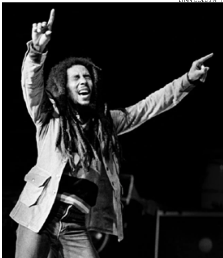
Bob Marley em show realizado no ano de 1980: artista é clássico do gênero