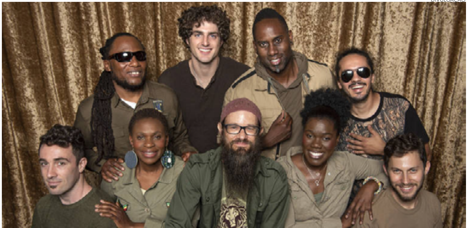
Roots: músicos realizam no palco improvisos e falam sobre questões essenciais à humanidade

Aliás, se há uma banda possível de o Groundation comparar-se é os Stones - não digo em termos sonoros ou estéticos, para os quais de fato não existem paralelos, e sim em respeito aos artistas roots. Se a música dos californianos nunca foi tão familiar ao leitor, aí te faço um apelo: vá agora mesmo ao Spotify, Apple Music, Youtube, enfim recorra a