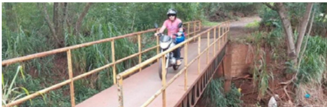
Passarela que ligava a Vila Sofia ao Setor Industrial foi removida. Nova ponte no local terá 15 metros de comprimento por 12 de largura — Foto: Reprodução.

A secretaria de Obras emitiu aviso alertando motociclistas e outros usuários sobre a interdição do trecho.