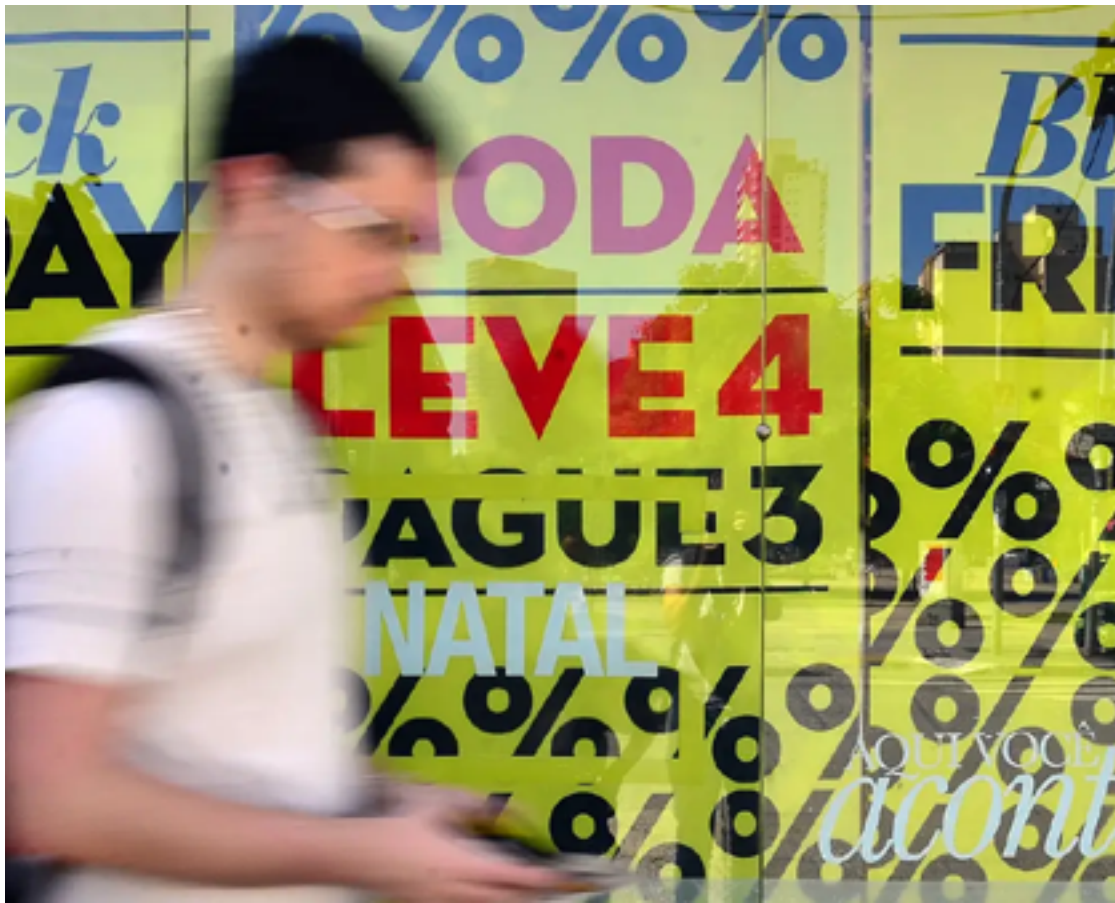
Segundo CDL cerca de 61% dos goianienses devem aproveitar as promoções da Black Friday desse ano

Consumidores atentos contam suas experiências com o dia de liquidação e o que, segundo eles, compensa comprar nesta semana em que o comércio promete “liquidações imperdíveis”