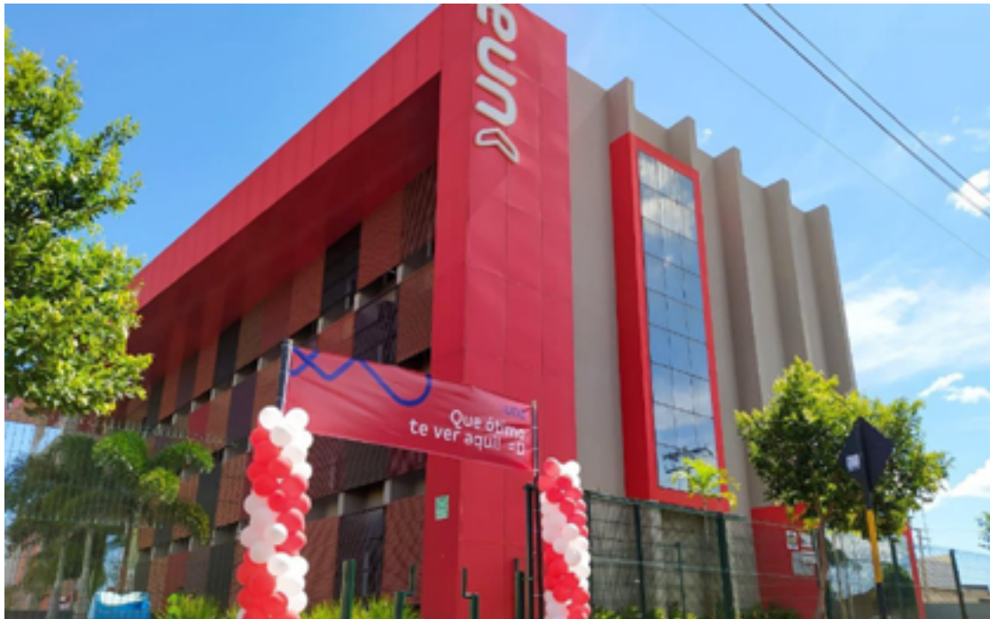
Faculdade UNA em Jataí: mostra de profissões em Jataí visa orientar estudantes na busca por carreiras — Foto: Reprodução.

Evento terá informações sobre programas, currículos, perspectivas de carreira e oportunidades. Objetivo é orientar estudantes na busca por caminhos educacionais e profissionais