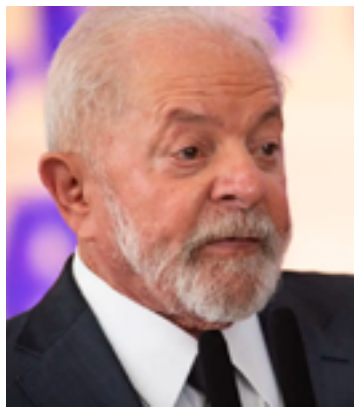
Lula da Silva

“Você não disputa a narrativa e o relato do medo com mais medo”, contou Nobel em uma entrevista ao Estadão. “É muito difícil você se impor discutindo