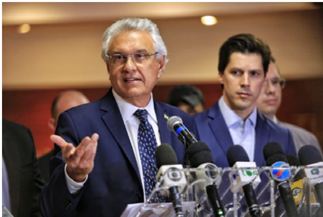
Ronaldo Caiado: forte liderança política em Goiânia e no interior do estado

Uma hipotética candidatura de Darrot, que provavelmente deve se filiar ao União Brasil, atenderia não só as expectativas do eleitorado goianiense, dizem os aliados governistas, mas também teria forças para contra-