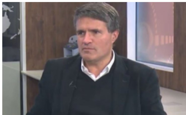
Murilo Hidalgo: governadores terão maior influência do que Lula e Bolsonaro

Tanto Ronaldo Caiado, quanto Daniel Vilela, porém, reforçam que uma definição sobre o nome da base à prefeitura de Goiânia nas eleições de 2024 só deve ocorrer no ano que vem, e será tomada ouvindo todos os aliados.