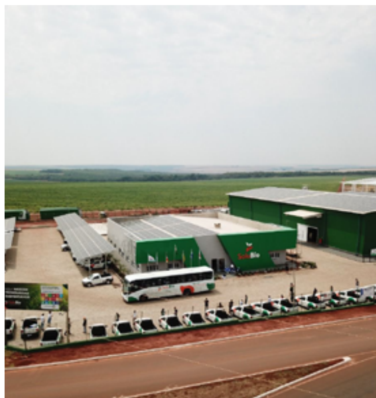
EM JATAÍ: Integrantes das missões diplomáticas participarão de um dia de campo na empresa Solubio, que atualmente a mais moderna fábrica de bioinsumos da América Latina