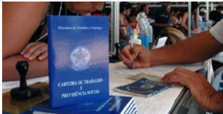
Possibilidades de ascensão são desiguais para população negra

Apesar de representar 56,1% da população em idade de trabalhar, os negros correspondem a mais da metade dos desocupados (65,1%).