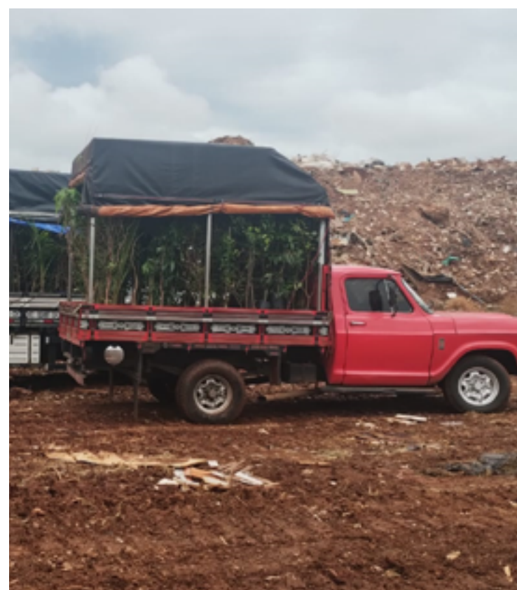
Comércio clandestino de mudas contribuem para a disseminação de vírus e bactérias altamente prejudiciais à sanidade no campo

Paralelo a esse trabalho de fiscalização, a Agrodefesa tem realizado o levantamento fitossanitário das lavouras de citrus, com vistas a mapear a presença de Cancro Cítrico, e garantir a ausência do HBL/Greening, considerada a pior praga mundial em Citrus, e que não foi registrada nas lavouras goianas, mas já foi identificada em Minas Gerais, Paraná, Santa Catarina e São Paulo, sendo esse último estado o mesmo de onde vieram as mudas identificadas e descartadas na operação.